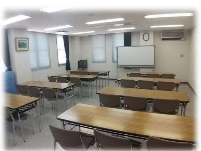
集会室 B 40人