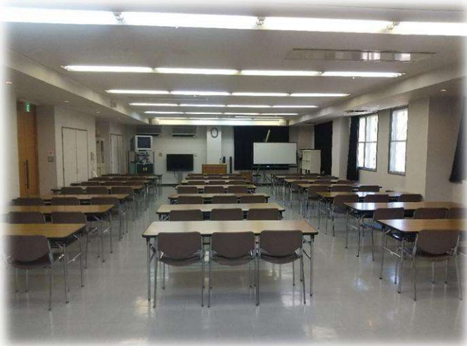
集会室 A 80人